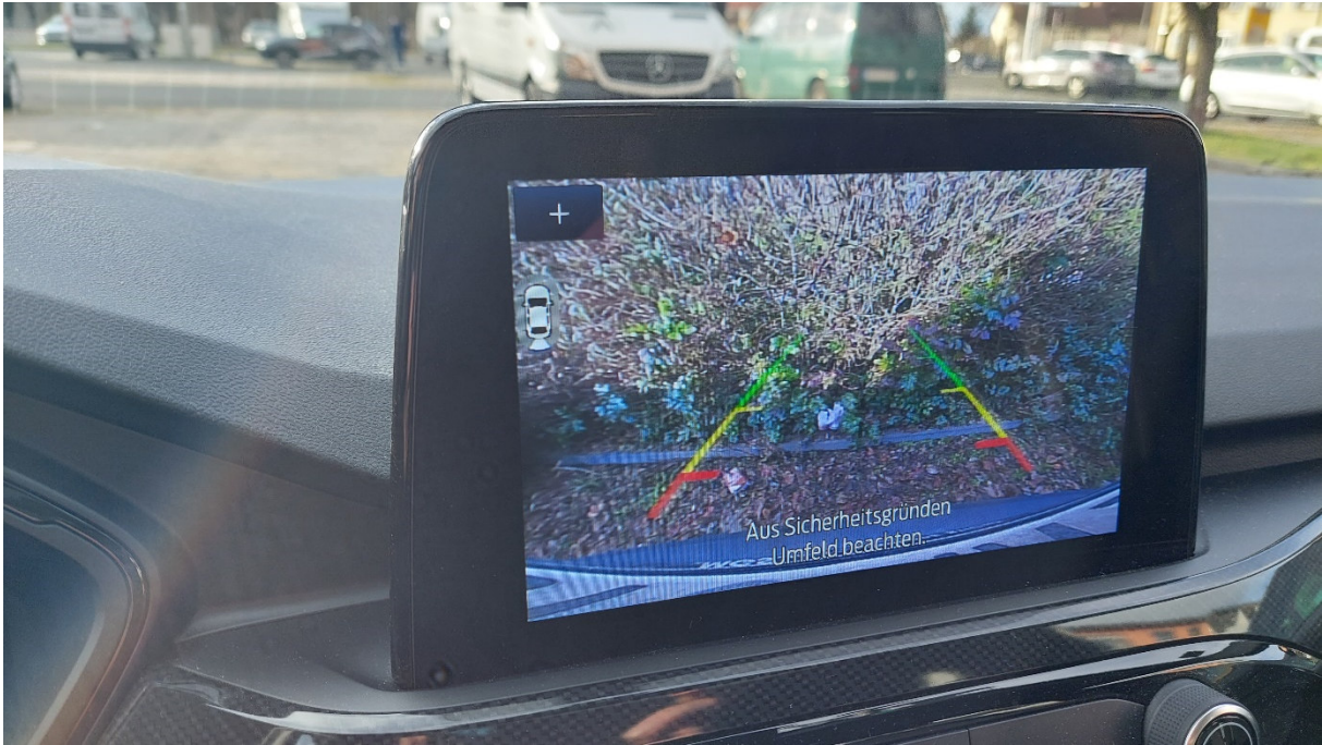
Bild 8 Rückfahrkamera kann zusätzlich zur Kontrolle benutzt werden