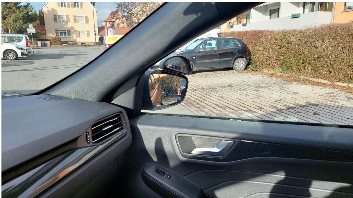
Bild 3 Kontrolle Abstand

Verkehrsbeobachtung rundum (auch Gegenverkehr) (Bild 3 und 4)